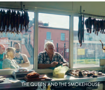
THE QUEEN AND THE SMOKEHOUSE

Im Auftaktmonat Juni liegt – in der ersten Monatshälfte – der Fo-