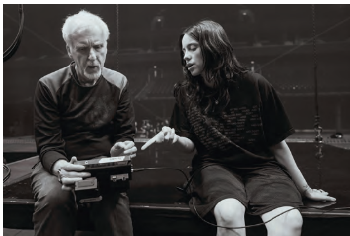
James Cameron und Billie Eilish: spielfreudige Perfektionisten unter sich.

Dazwischen sitzt man gemeinsam im „Welpenraum“: Eilish hat „Puppy Rooms“ hinter der Bühne etabliert – zwecks Stressabbau und Entspannung für ihr Team und sich selbst. Er würde das beim nächsten Filmset auch so machen, zeigt sich Cameron begeistert.