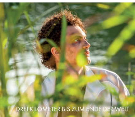
DREI KILOMETER BIS ZUM ENDE DER WELT