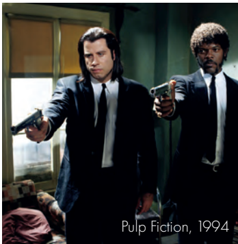
Pulp Fiction, 1994