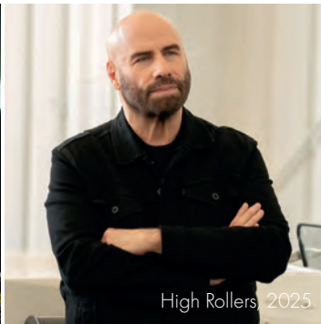
High Rollers, 2025