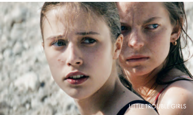
LITTLE TROUBLE GIRLS