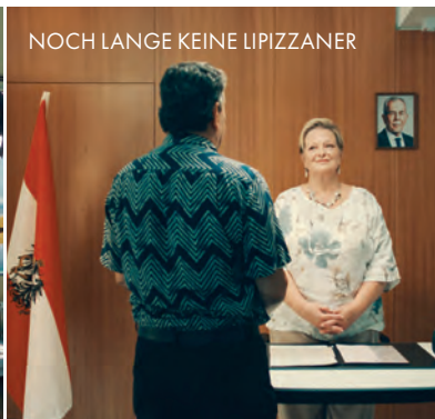
NOCH LANGE KEINE LIPIZZANER