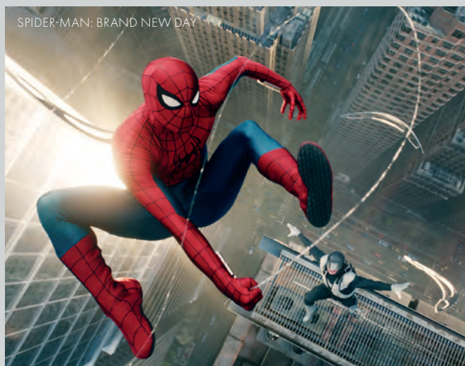
SPIDER-MAN: BRAND NEW DAY