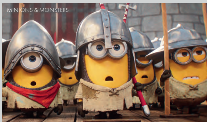
MINIONS & MONSTERS