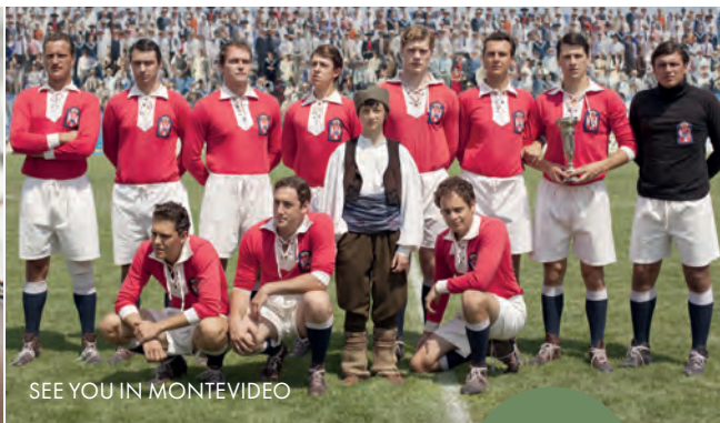
SEE YOU IN MONTEVIDEO