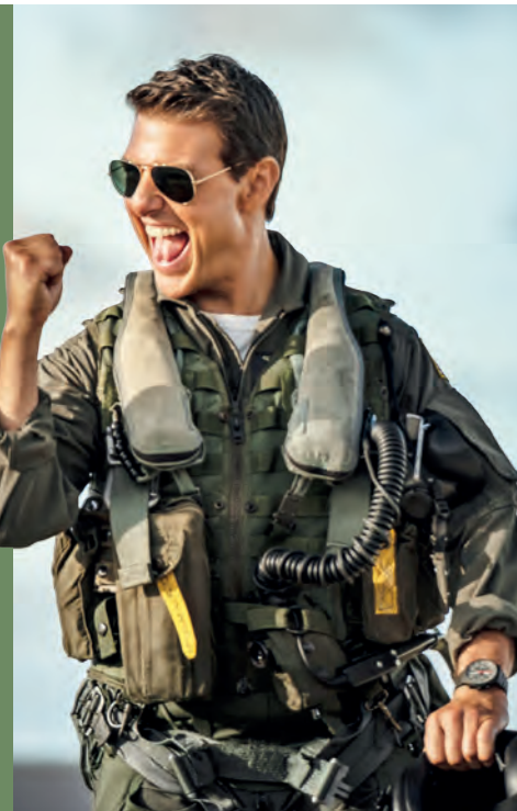
Tom Cruise als Captain Pete „Maverick“ Mitchell in „Top Gun: Maverick“

TOP GUN: MAVERICK KINOSTART 13.05., USA 2019, REGIE Joseph Kosinski, MIT Tom Cruise, Miles Teller, Jennifer Connelly, Val Kilmer, Glen Powell, Ed Harris, FILMLÄNGE 131 Min., © Constantin Film