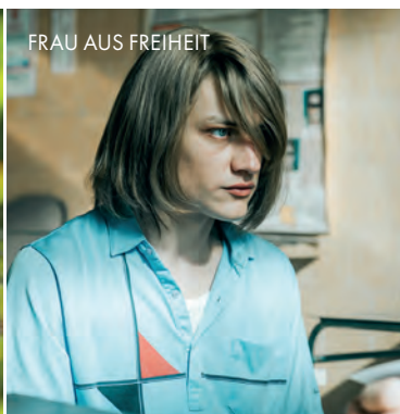
FRAU AUS FREIHEIT